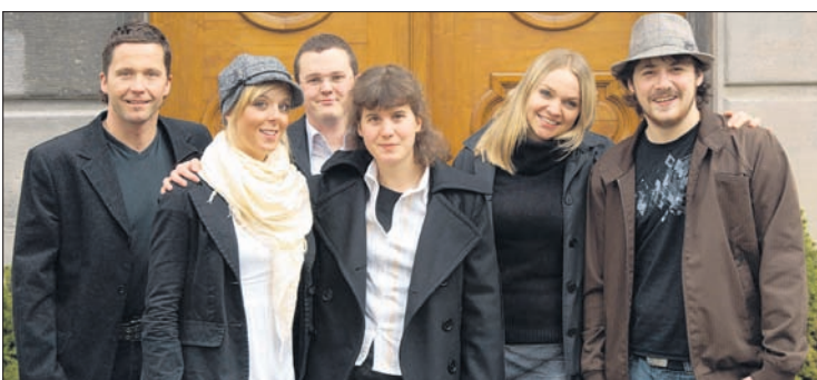
Forschungsergebnisse werden häufig von einer jungen Generation erarbeitet.

Die Academia Raetica wird am 25. und 26. August 2010 im Auditorium der Graubündner Kantonbank in Chur eine Tagung veranstalten, die aufzeigen soll, wie umfangreich, wirtschaftlich relevant und international bedeutend die Forschung in Graubünden ist. Eingeladen sind Forscherinnen und Forscher, die in Graubünden arbeiten, aber auch jene, die eine Arbeit über Graubünden schreiben. Die Politik und Wirtschaft, aber auch die Öffentlichkeit sind eingeladen, dabei zu sein. Es ist zu erwarten, dass die dynamische Bündner Forschungsszene auch künftig für Schlagzeilen sorgen wird. Das Amt für Höhere Bildung wird über die Highlights dieser Veranstaltung ein Porträt produzieren, das auf TSO ausgestrahlt werden wird.