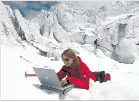
Graubünden bietet nicht nur Freizeitwert, sondern ist häufig selbst Gegenstand der Forschung.