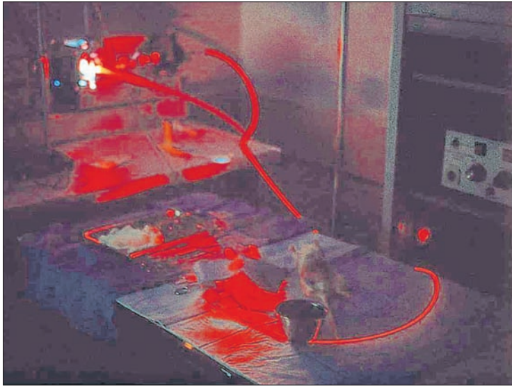
Das Licht wird beim klinischen Einsatz der photodynamischen Therapie über Lichtkabel direkt zum Tumor geführt.