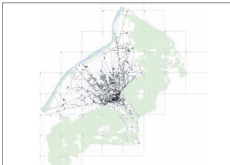
Ausdehnung der Stadt Chur im Jahr 1950.

Vor dieser Zeit existieren keine Gesamtpläne