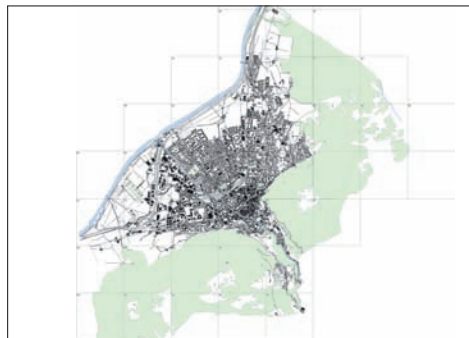
Ausdehnung der Stadt Chur im Jahr 2000.

Der «Historische Städteatlas Chur» ist interdisziplinär angelegt und Teil des Projekts «Historischer Städteatlas der Schweiz». Er ist eine Zusammenarbeit des Instituts für Kulturforschung Graubünden mit dem Architekturbüro bosch&heim in Chur und dem