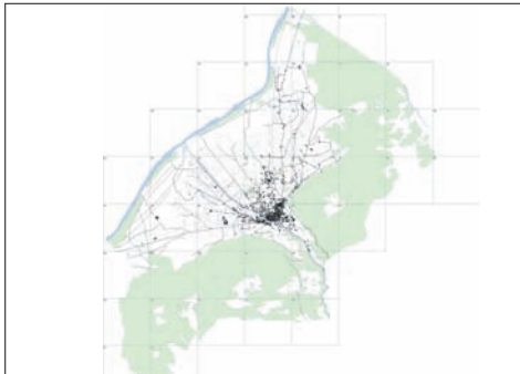
Ausdehnung der Stadt Chur im Jahr 1900.

Die hiesigen Tourismusfachleute werben gerne mit dem Slogan «Chur, die älteste Stadt der Schweiz». Tatsächlich lassen sich Spuren einer bemerkenswert frühen Besiedlung nachweisen. Für die Bewohner dieser Region ist es eine Bereicherung, das geschichtliche, kulturelle und wirtschaftliche Erbe zu kennen. Der Blick in die Vergangenheit ermöglicht es dem Einzelnen wie der gesamten Gesellschaft, die eigene Lebenswelt besser verstehen und folglich die Zukunft bewusster gestalten zu können. Das in Chur situierte Institut für Kulturforschung Graubünden erarbeitet zurzeit einen «Historischen Städteatlas Chur». Er dokumentiert die Siedlungsentwicklung von den Anfängen bis in die heutige Zeit.